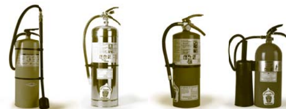
Sable sec (D)